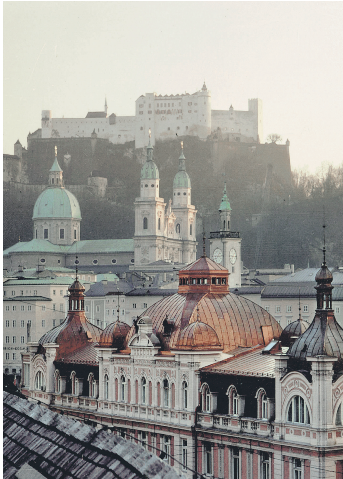
Das Bankhaus Spängler ist mit insgesamt rund 260 Mitarbeitern an Standorten in Stadt und Land Salzburg, Linz, Wien, Graz und Kitzbühel vertreten. Direkt an der Staatsbrücke in der Stadt Salzburg befindet sich das Stammhaus des Bankhaus Spängler.